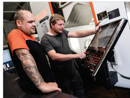
Zdejší tým zkušených pracovníků, ve spojení s dokonalými stroji, je schopen splnit zákaznickovi prakticky jakékoli přání.

Tak se předání žezla realizovalo krůček po krůčku, zatím po dobu dvou let, přičemž na začátku bylo stanoveno, že tento „předěl“ bude trvat celkem zhruba pět let. Na předávání vedení však nechtěla být rodina sama, a tak právě na ono přechodné období angažovali poradce – zkušeného manažera, který prošel více obory.