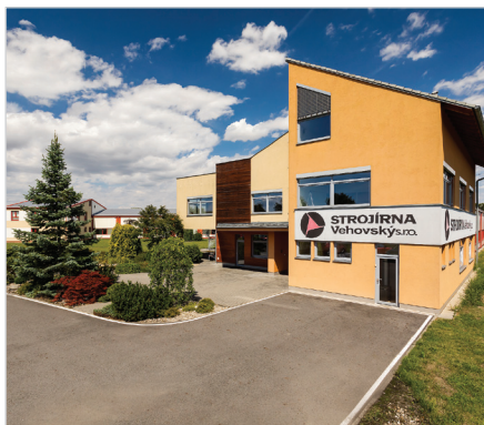
V roce 2002 bylo postaveno současné sídlo v Oticích u Opavy.