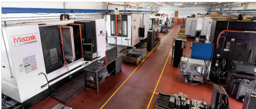
V současné době pracuje ve Strojárně Vehovský 15 strojů značky Mazak a zhruba sedm strojů dalších značek.